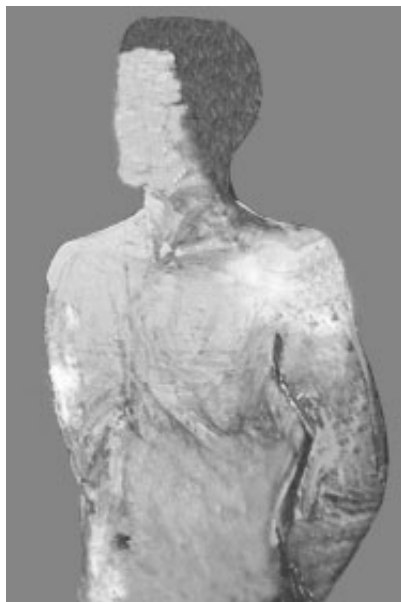
Vision de Jésus

Le 13 mai 1970, Jésus me révéla enfin le secret annoncé de la manière suivante: me réveillant à l'aube, je Le vis comme un homme de Lumière taillé dans du marbre blanc rayonnant, se tenant au chevet de mon lit. Une paix profonde, une assurance et une puissance invincible émanaient de Lui.