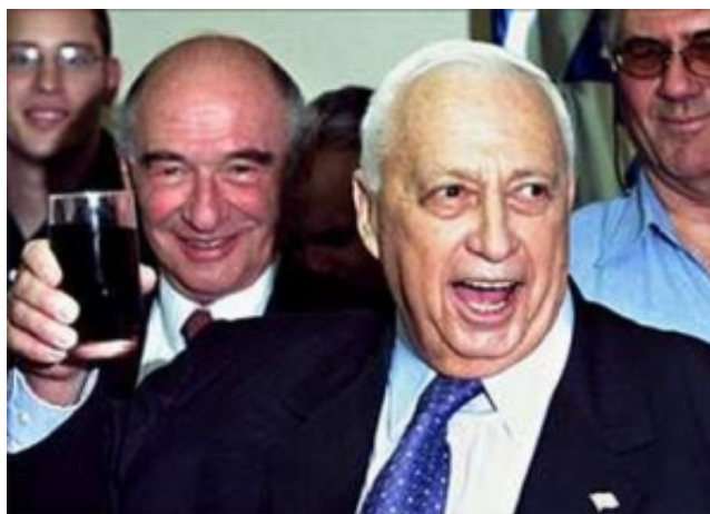
"La femme se saoulait du sang des saints et du sang des martyrs de Jésus (Apocalypse 17,6)"

La Prostituée est "la femme assise sur la Bête" (Apocalypse 17,3-5). Jean explique que "cette femme-là, c'est la Grande Cité (Jérusalem), celle qui règne sur les rois de la Terre" (Apocalypse 17,18). Elle règne sur les "10 rois" et, par eux, sur les autres chefs d'États et leurs armées. Jean la vit "scindée en trois parties": juive - chrétienne - musulmane (Apocalypse 16,19), mettant fin au rêve sioniste.