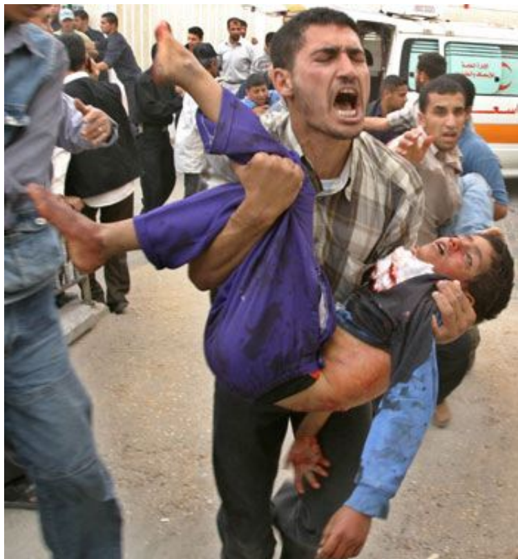
"Dans les bras de ce père ivre de douleurs, un petit palestinien victime de la violence israélienne"