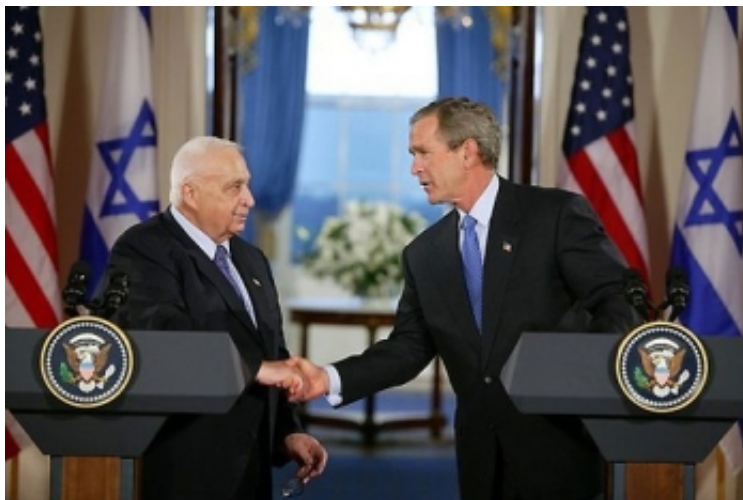
La deuxième Bête au service de la première

première Bête dont la plaie mortelle fut guérie... et nul ne pourra rien acheter ni vendre s'il n'est marqué au nom de la Bête" (Apocalypse 13,11-17). Je déduisis alors que la première Bête étant Israël, la deuxième Bête qui la soutient ne peut être que les U.S.A qui protègent et arment Israël. Je compris encore qui sont ces "ennemis que je m'attirerais" et qui est la "foule de peuples, de nations, de langues et de rois contre qui il me fallait de nouveau prophétiser", puisque le témoignage contre Israël ne se fait plus aujourd'hui comme les Prophètes et Jésus le faisaient autrefois (voir par exemple Isaïe 1,2-4 / Jérémie 2,26-37 / Michée 3,9-12 / Matthieu 23,33-37 / Jean 8,44).